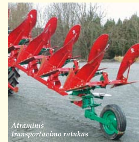
Atraminis transportavimo ratukas

Išpurenti, susmulkinti grumstus bei išlyginti dirvą gali kartu su plūgais agreguojamas pakabinamasis arimo volas PAC-