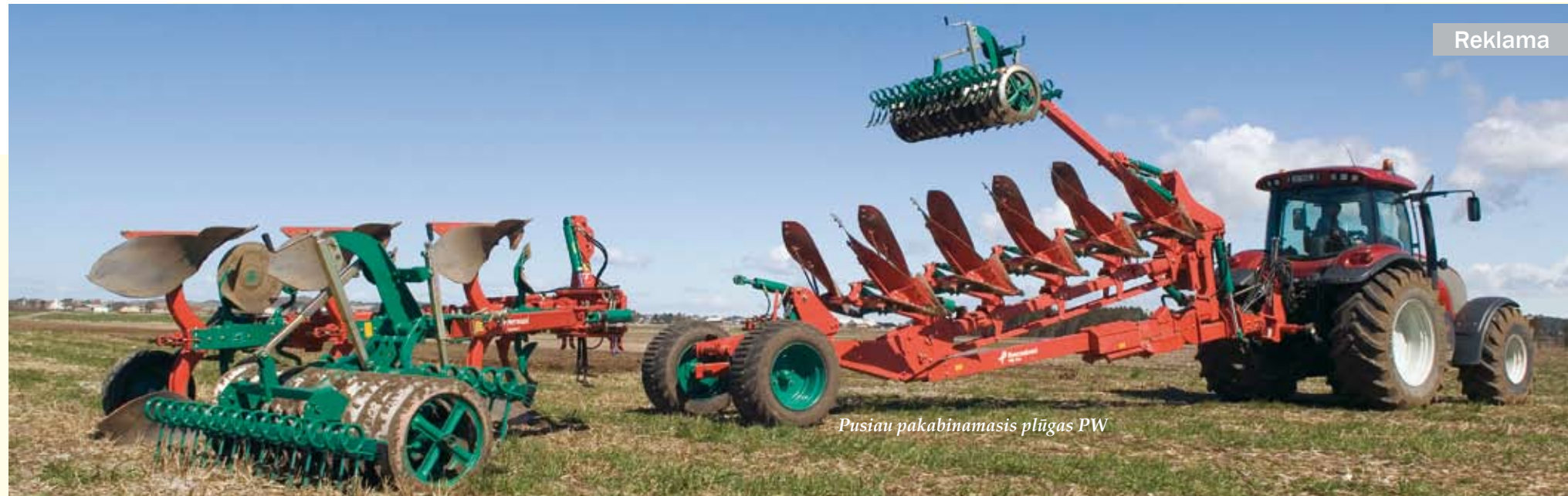
Pusiau pakabinamasis plūgas PW

Dažniausiai naudojami 3, 4 ar 5 korpusų tradiciniai, t. y. paprasti plūgai, ar didesni (6, 8 korpusų) – pusiau pakabinamieji arba prikabinamieji. Pakabinamųjų plūgų privalumas yra tas, kad pradėdant darbą juos galima tiksliai nuleisti į numatytą vietą. Dirbant su pusiau pakabinamuoju plūgu, reikia specialiai manevruoti, sunkiau dailiai baigti lauko arimą. Paprasti, t. y. tradiciniai plūgai, palieka lauke sumetimus ir išmetimus, kurie blogina lauko reljefą, reikia papildomų pastangų laukui padalyti (suskirs-