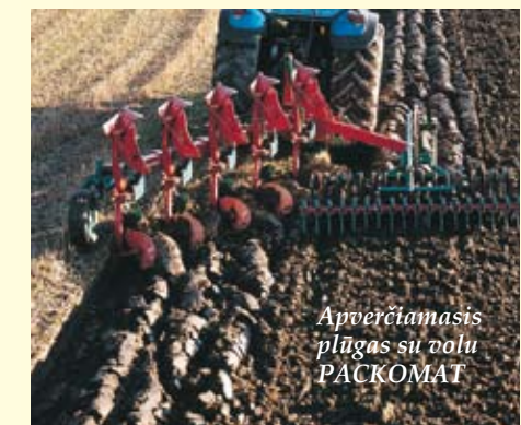
Apverčiamasis plūgas su volu PACKOMAT

KOMAT . Dirbant su juo, nors važiuojama tik vieną kartą, lauko paviršius atrodo kaip po kultivavimo.